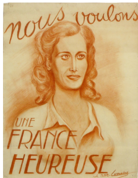
Dessin de «Lorraine»

Du 22 mai au 6 septembre - Musée Vernissage : vendredi 24 mai - 18h30 EXPOSITION TEMPORAIRE