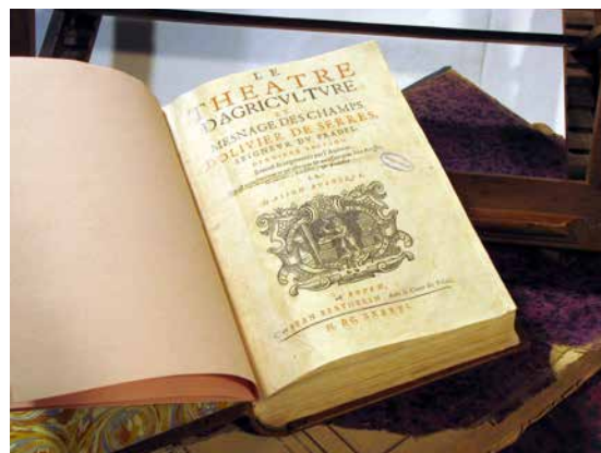
Théâtre d'agriculture et ménage des champs , Olivier de Serres, 1646, BIB 4 1018.