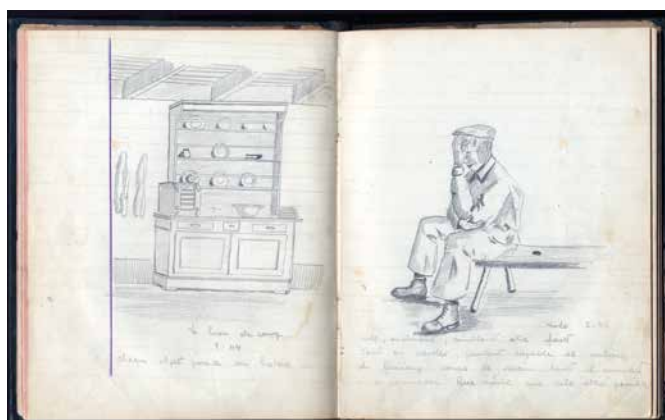
Extrait d'un carnet de dessin, 1944, collection particulière.

Des œuvres de ce jeune artiste amateur se dégagent une maîtrise du trait, de la perspective, des jeux d'ombre, un sens de l'observation allant parfois jusqu'au souci du détail : moulin à café sur le linteau de la cheminée, poste TSF sur le buffet, tablier de la vieille paysanne. Avec réalisme, il fige un instant de la vie quotidienne des maquisards du Sampaix. Il rappelle la nomadisation dans une région au relief accidenté durant le rude hiver 1944, la guerre omniprésente : armes, parachutages,