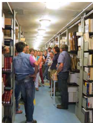
Visite des silos, septembre 2014.

Qui n'a pas rêvé telle Alice au Pays des Merveilles de passer de l'autre côté du miroir, d'entrer dans les coulisses, de découvrir des endroits inaccessibles ou impénétrables ?