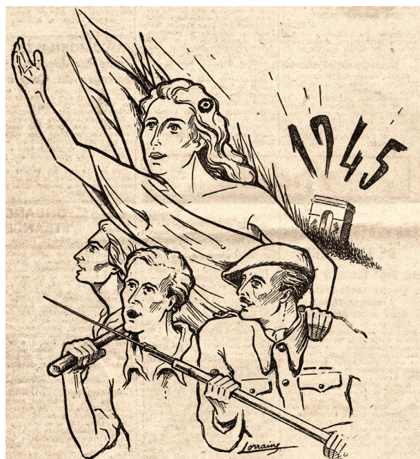
Illustration de Robert Petit-Lorraine, parue dans la Voix du peuple du 31 décembre 1944.