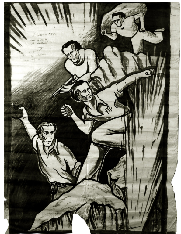
L'Assaut FTP nous a rendu la Liberté Ebauche d'affiche de Robert Petit-Lorraine, 1944.

> 7 août à 11h: Chants de guerre, guerre des chants.