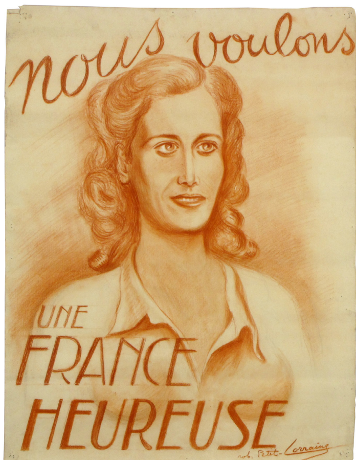
Nous voulons une France heureuse

Une quinzaine de ses affiches seront exposées en original ainsi que des dessins et des illustrations de l'artiste, rarement présentés dans les expositions qui lui ont été consacrées. Il s'agit de permettre au grand public de découvrir cet ensemble remarquable tant par sa qualité artistique que par sa valeur historique .